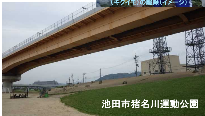
池田市猪名川運動公園