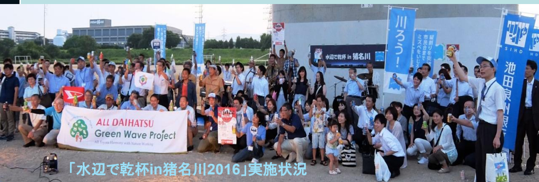
「水辺で乾杯in猪名川2016」実施状況