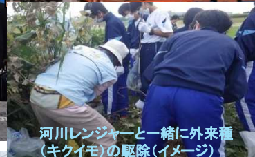
河川レンジャーと一緒に外来種(キクイモ)の駆除(イメージ)